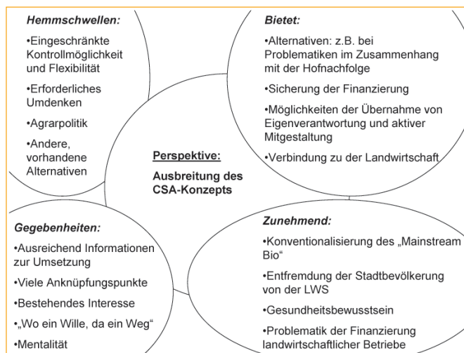
Abb. 2: Zukunftsperspektiven des CSA-Konzepts

Das CSA-Konzept bietet darüber hinaus Lösungsmöglichkeiten für bestehende soziale und landwirtschaftliche Probleme, z. B. im Zusammenhang mit der Hofnachfolge oder bei der Finanzierung einer nachhaltigen Landwirtschaft. Durch die Abkoppelung des Beitrages von den Produkten kann ein sozialer Ausgleich geschaffen werden, der es Menschen mit geringem Budget erlaubt, teilzunehmen und ggf. Mithilfe als Gegenleistung einzubringen. Das CSA-Konzept stellt für kleine Höfe eine Chance dar, ihre Existenz zu sichern, und ermöglicht landwirtschaftlichen Betrieben die Unabhängigkeit von Subventionen. Hofneugründer können sich auf diese Weise in der Umgebung etablieren. Nicht zuletzt stellt das CSA-Konzept eine Chance zur Verwirklichung ideeller Ziele dar. Die verschiedenen Aspekte der Zukunftsperspektiven des CSA-Konzepts, die in den Interviews genannt wurden, sind in Abbildung 2 zusammengefasst.