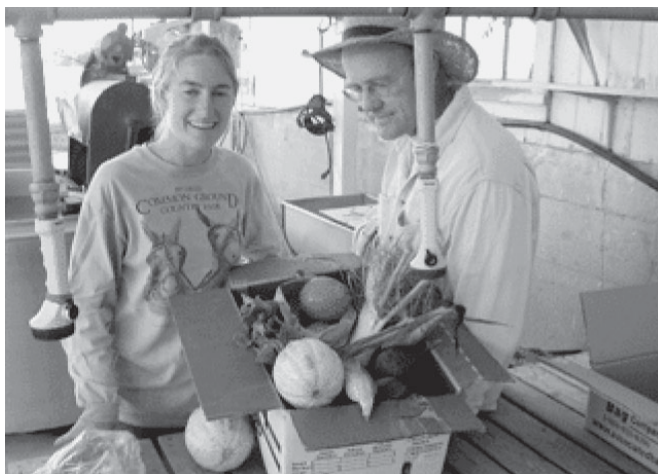
Kunden werden zu Kollegen – das Modell der partnerschaftlichen Abokiste ist in den USA erfolgreich und wurde durch Farmer John in Europa bekannter

Die stärkere Verbreitung von CSA im Ausland wird auf die unterschiedliche Mentalität, die unterschiedliche Verwendung des Begriffes CSA und auf in Deutschland bereits vorhandene alternative Vermarktungsmodelle wie die Abokiste, zurückgeführt. In den USA z. B. werden bereits über 2500 CSAs betrieben (STRÄNZ 2007). Andere Länder sind Deutschland durch Interessensverbände sowie nationale und internationale Netzwerke, die die Umsetzung des CSA-Konzepts fördern und vorantreiben, voraus. Beispiele hierfür sind die Soil Association im Rahmen von Cultivating Communities in England und Alliance PEC in Frankreich. Urgenci ist ein internationales Netzwerk, das zum Ziel hat, auf Lokalität und Solidarität